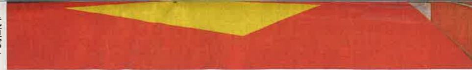
スポーツストリート