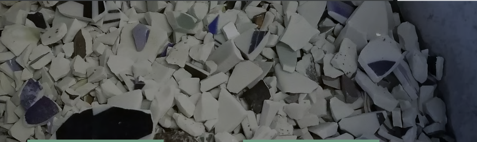
ベンチ | テラゾーベンチ